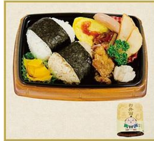
おむすび弁当(竹) 550円(税込) オムレツ、ウインナー、ポテト、唐揚、しゅうまい等お子様が嬉しくなるおかず+食べやすいおむすびのお弁当です。(W18.5×H13.5cm)