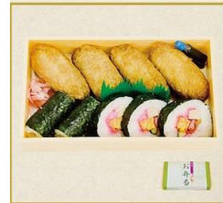
助六寿司 550円(税込) 創業から変わらぬいなり寿司の味をご堪能ください。(W19.5×H12cm)