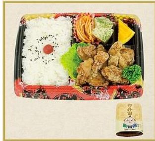
唐揚 弁当 550円(税込) 子供から大人まで幅広い人気のジューシーな鶏唐揚弁当です。(W20×H14cm)

注：お弁当到着は11：30頃を予定しております。 尚、キャンセルは出来ませんのでご注意ください。